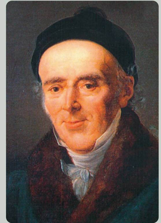
Samuel Christian Hahnemann Begründer der Homöopathie 1755-1843