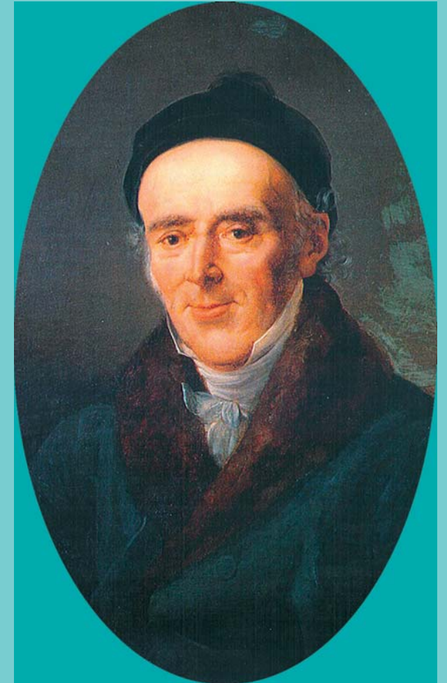
Samuel Christian Hahnemann Begründer der Homöopathie 1755-1843