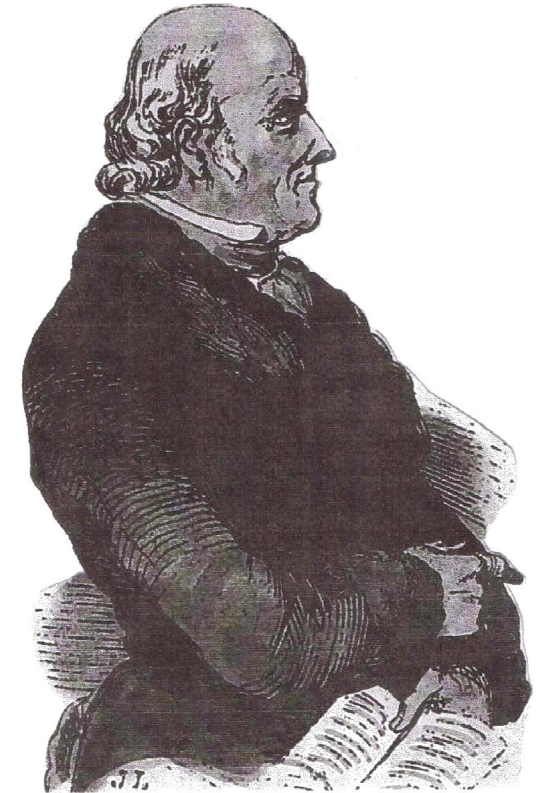
Samuel Christian Hahnemann Begründer der Homöopathie 1755-1843